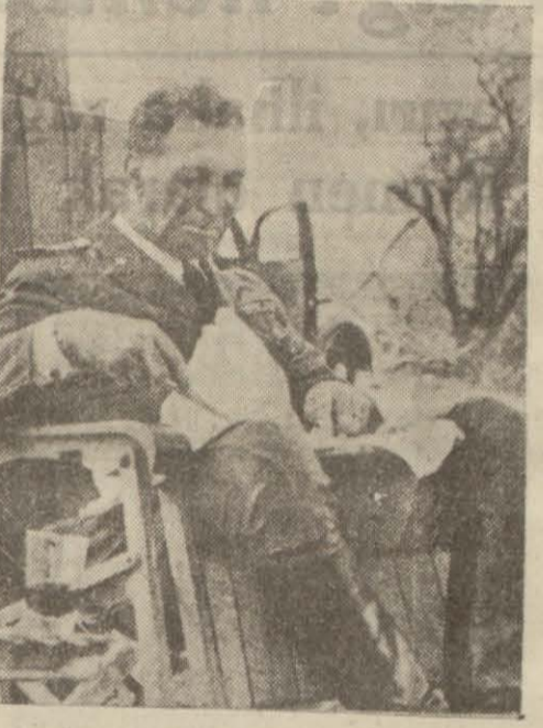
Mareşal Graziani Habeş seferi esnasında bir öğle üstü yemek yerken

1939 senesi Teşrinievveli nihayetinde ordu erkânharbiye riyasetine getirilmiş ve kolordular ikinci grupu kumandanlığı uhstesine verilmiştir.