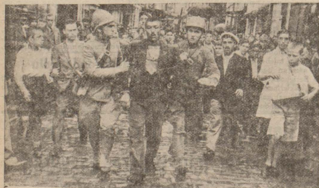
Mahkûm tekrar ele

Dün adliyyeye getirilmekte olan ağır cezalı bir mahkûm, adliyenin methal kapısından girerken birdenbire kendisini muhafaza eden jandarmın elinden kaçmış ve Sirkeci'de heyecanlı bir takibe sebep olmuştur.